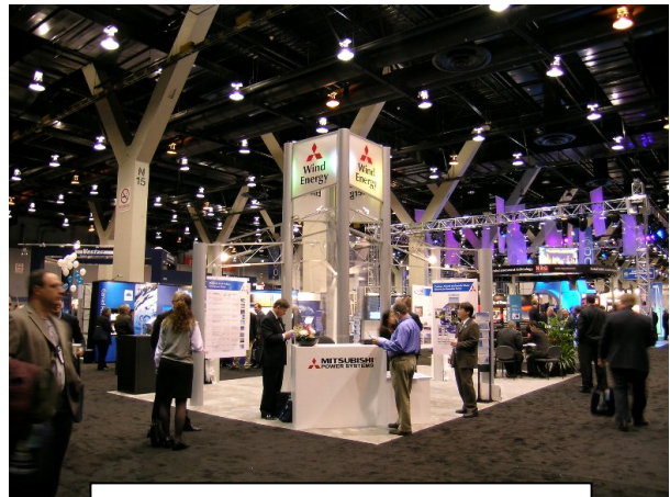
三菱パワーシステムズ・ブース

カンファレンスは主に発表・展示・交流会により構成され、225 の展示ブース、43 の分科会と約 300 の発表、130 のポスターによる展示が行われました。展示は欧州風力協会、英国風力協会、カナダ風力協会、リソ (デンマーク国立研究所) などの組織のほか、ヴェスタス、ミーコン、ガメサ、GE、ボーナス、三菱などの風車メーカーをはじめとして、LM ブレードなどの部品メーカー、事業会社、コンサルタント、建設会社、保険会社など、考える全ての風力発電関連の企業が参加しました。