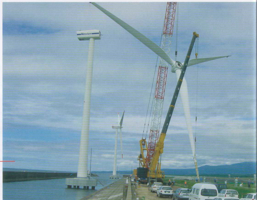
Installing Japan's first turbines in the sea