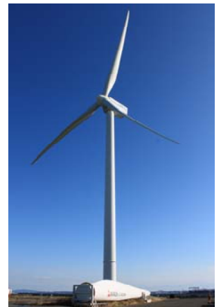
↑ 三菱 MWT100/2.4 ↓ ハマウイング

主催 日本風力発電協会および日本風力エネルギー協会（連名でGWECに加盟）、 横浜市地球温暖化対策事業本部 協力 三菱重工業株式会社 横浜製作所