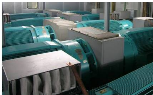
図2 組合せ試験装置

弊社コンバータの特徴は、ほとんど主要な発電機メーカーの発電機と組み合わせることが出来る点です。またモジュラー設計を行っているため容易に 600kW から 6MW の風車にまで搭載することができ、良好な稼動を続けています。また先進的な FRT (Fault Ride Through) 機能は国際 Grid Code をカバーするだけでなく機械的ストレスを低減する機能をも実現しています。風車はその特性から、設置される場所が様々であり、 -30^{\circ}\text{C} からの運転や +50^{\circ}\text{C} での運転、あるいは洋上、陸上を問わず過酷な運用環境に耐える堅牢さを兼ね備えています。