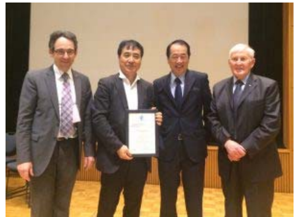
福島市での表彰式の様子(飯田哲也氏)

http://www.wwindea.org/world-wind-honorary-energy-award-2016-for-extraordinary-personal-achievements-for-tetsunari-iida-for-his-promotion-of-community-power/