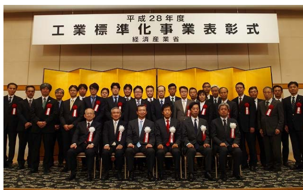
表彰式(全員の集合写真)