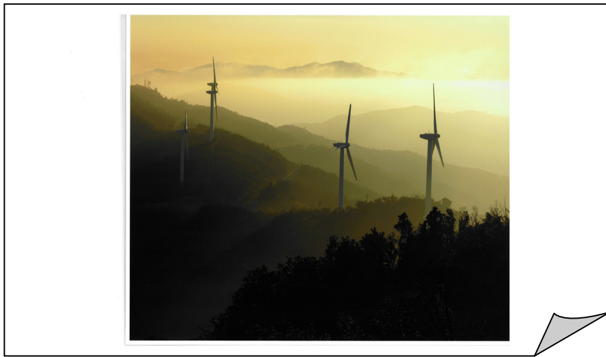
上写真「2007年フォトコンテスト優秀作品」

募集期間：2008年7月15日～2008年9月30日まで 当日消印有効 募集要項：お一人様3作品まで、応募できます。