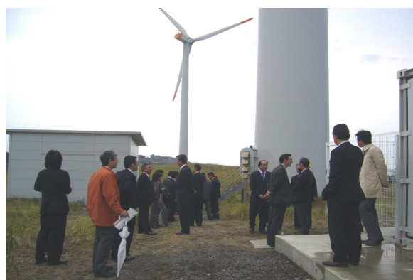
西目風力発電所（安定化装置付）見学会