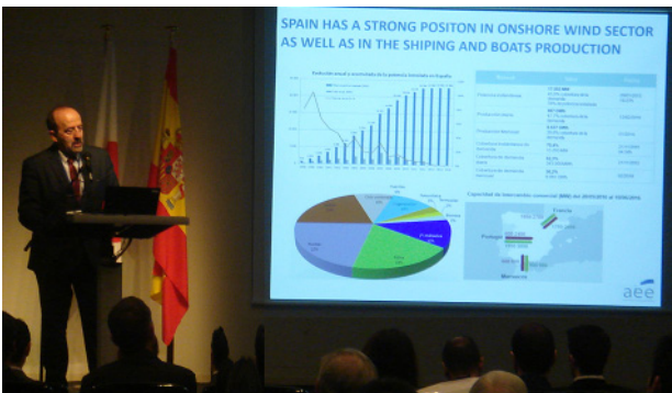
スペイン洋上風力セミナーの様子

発表者：CENER, Ingeniería, Ingeniería, Vicinay Marine, CT Ingenieros, Isati, APPA Marina, Adwen, AEE, CDTI, NEDO 参加者：スペイン側21人、JWPA側39人 内容：コンクリ製タワーや、カナリア諸島での先端研究(トップラ搭載風況計測ブイ、自航&自沈式重力基礎。コンクリ製伸縮タワー等)の紹介あり。