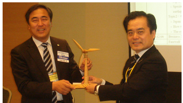
台湾洋上風力交流会の様子

内容：台湾は4～11GWの壮大な洋上風力の導入目標を掲げ、Formosa1 phase1の4MW×2台を設置完了、Phase2の120MWに向けて台中港に拠点を整備中。