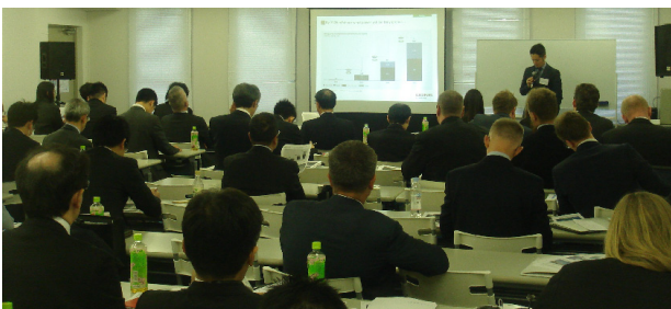
デンマーク洋上風力セミナーの様子