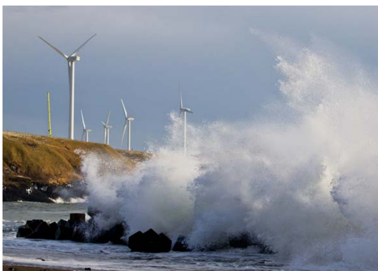
「荒波と風車」