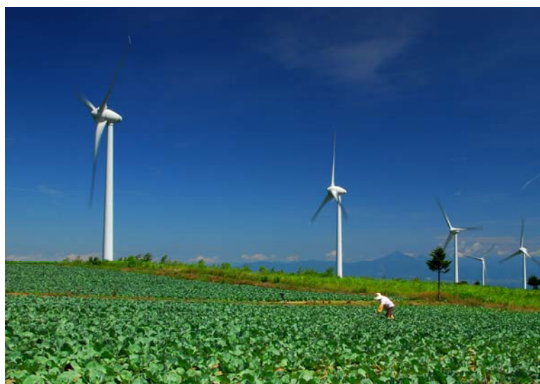
「高原の空の下で」