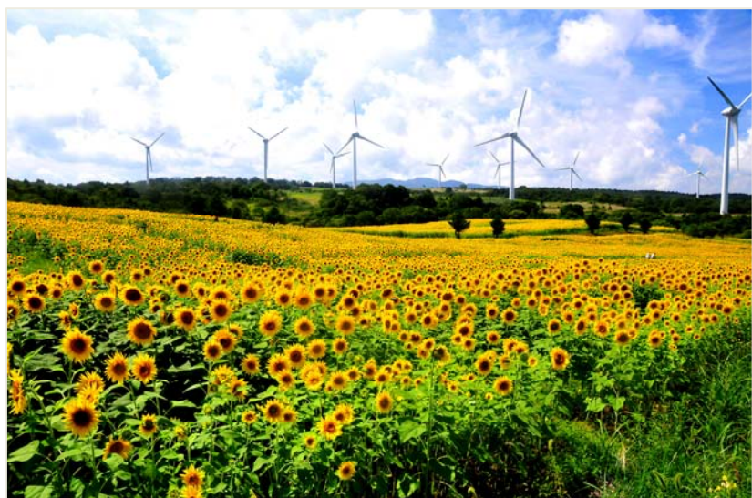
「晩夏の風」