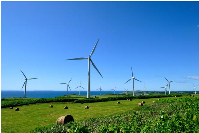
「風の牧場」