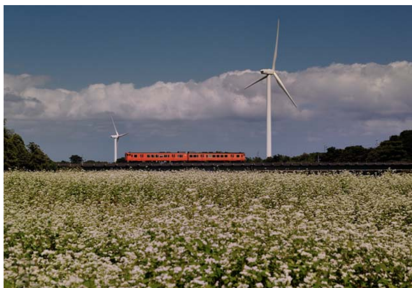
「蕎麦の花が咲く頃」