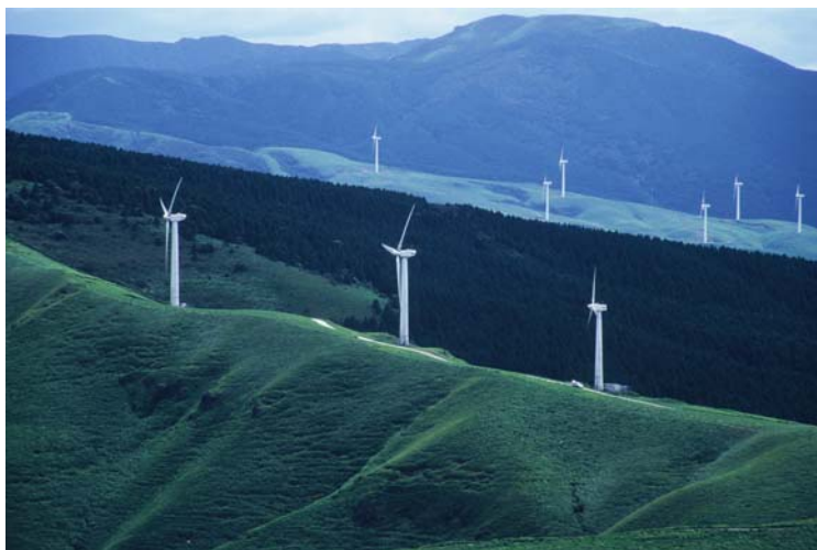
「稜線の彼方に」