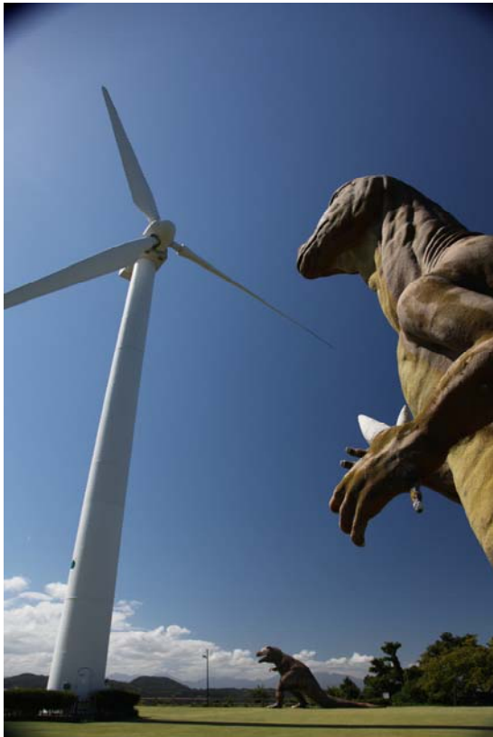
「怪獣現れる」