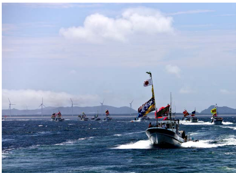
「大漁旗船団」