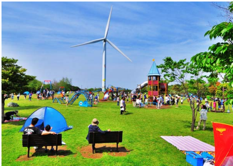
「春の公園風景」