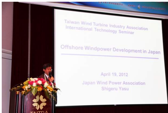
図4 台湾風車工業会設立イベント（安副部会長）