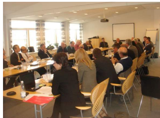
図2 GWEC の総会と理事会