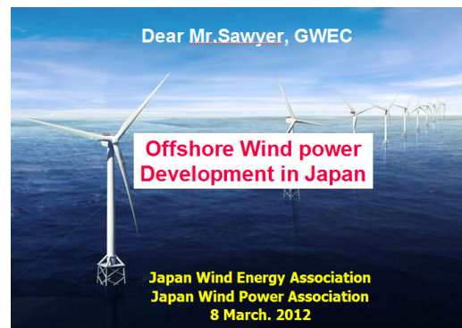
図1 日本の洋上風力の紹介（GWEC 交流会）