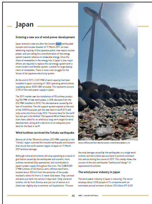
図5 GWEC Global Wind Report Annual market update 2011 内の日本トピックス

また、JWPA ホームページの英語版を整備し、ニューストピックスの英訳を掲載しています（図7）。