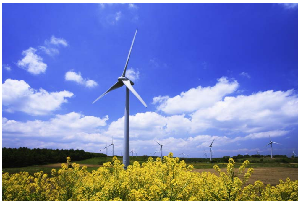
「菜の花の咲く頃」