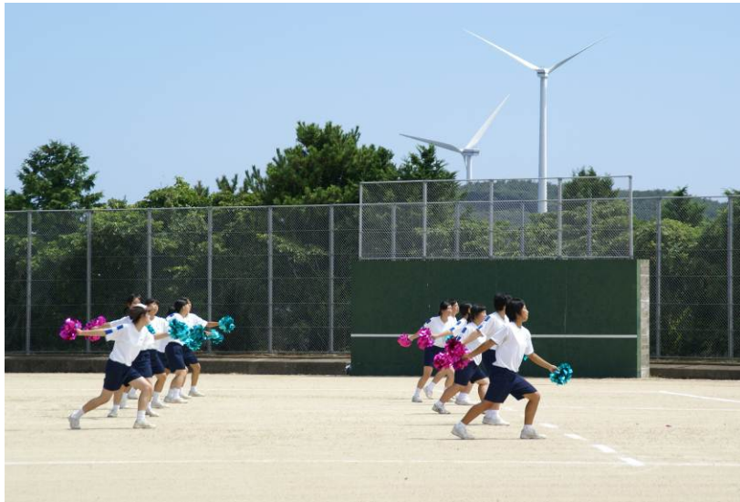
「エコゾーグラウンド整備係『風車』たち」