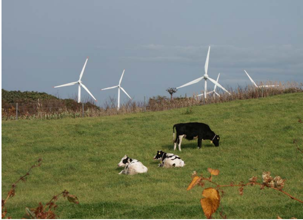
「風車とたわむれる放牧牛」