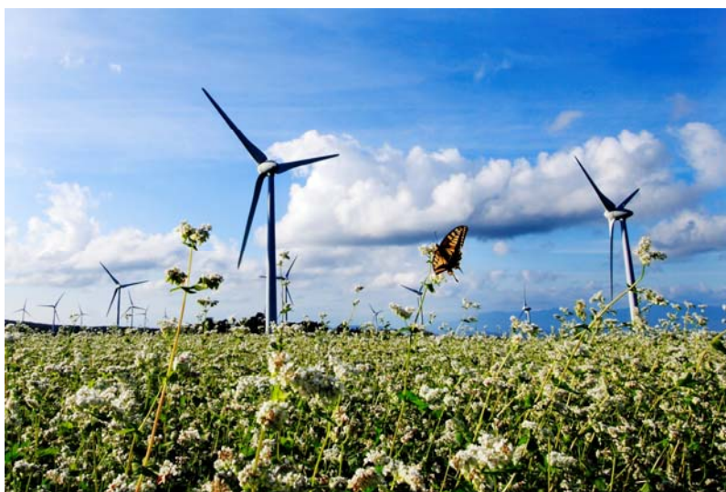
「羽根の共演」