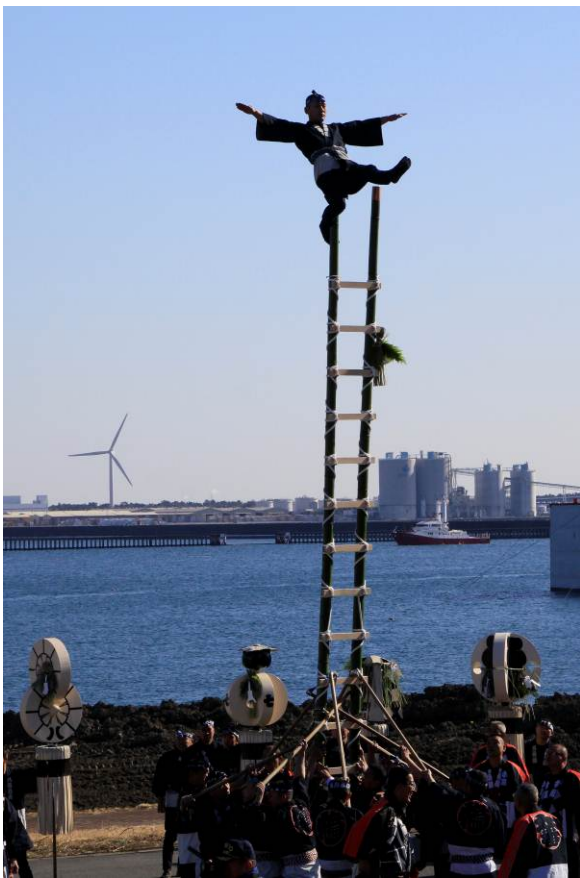
「新春梯子乗り」