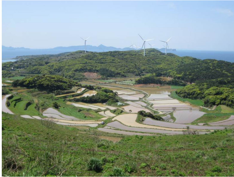
「自然との融合」