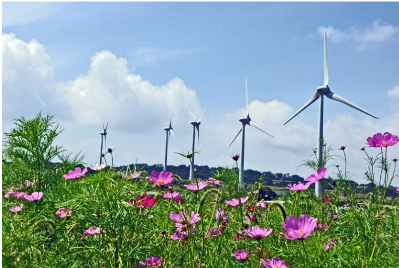
「秋の風力」