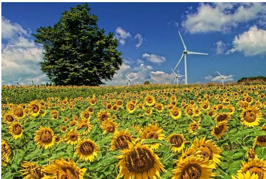
「向日葵畑を渡る風」