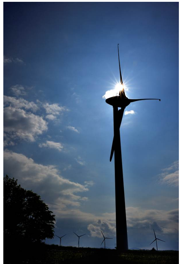
「冠を頂く高原の風車」