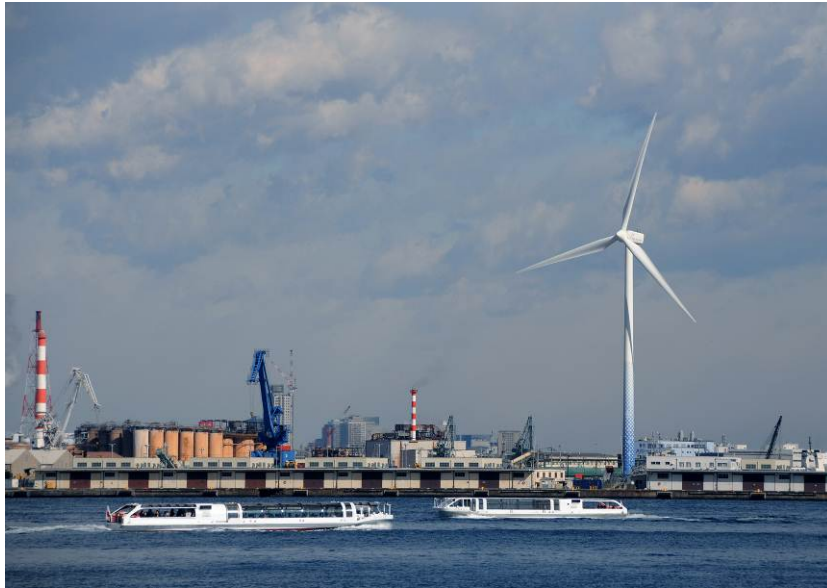
「港の中の風車」