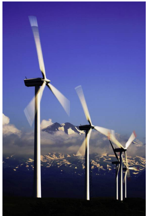
「日本海からの風を受けて」