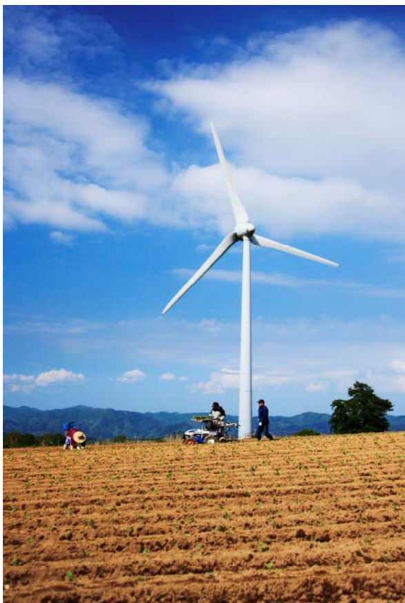
「早春の高原」