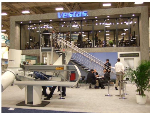
欧州風車メーカーの展示

AWEA主催の米国の風力展示会で、5月23日～26日に米国テキサス州Dallasで開催されました。米国は2009年だけで10GWの風車が建設された大風力市場なので、関連企業約1400社が出展し、来場者は約2万人と盛況でした。従来の欧米風車メーカーに加えて中国風車メーカーも参加していたのが目新しい点です。