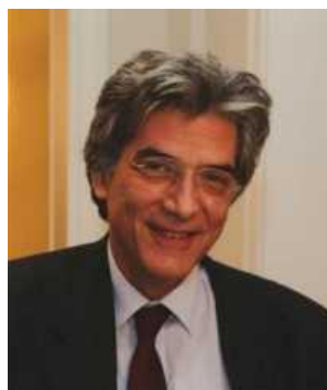
Arthouros Zervos 氏

ここ数年間、世界の風力発電の顔として活躍された Zervos 議長は退任され、今後はギリシア電力の社長に就任されるそうです。