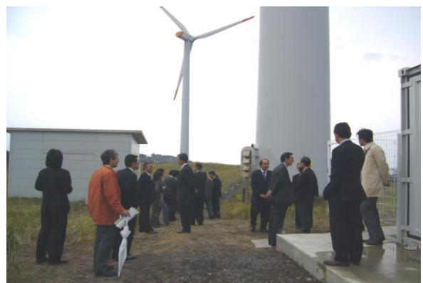
西目風力発電所（安定化装置付）見学会